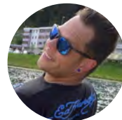
Mathias Spiess Festwirtschaft